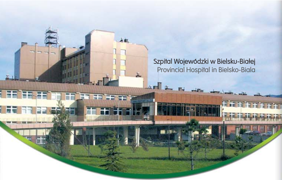
Szpital Wojewódzki w Bielsku-Białej Provincial Hospital in Bielsko-Biala