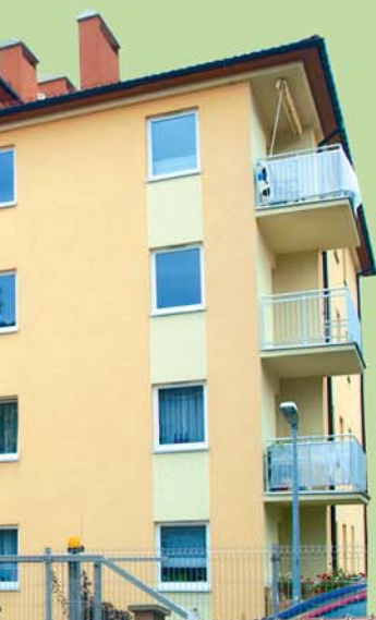
Budynek wielorodzinny w Bielsku-Białej. Construction of multi-family buildings in Bielsko-Biala.