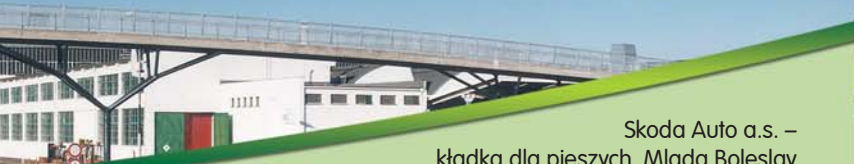
Skoda Auto a.s. – kładka dla pieszych, Mlada Boleslav Skoda Auto a.s. – footbridge, Mlada Boleslav

Modernizacja i rozbudowa oczyszczalni ścieków w Komorowicach – realizacja dostosowująca oczyszczalnię do wymogów unijnych.