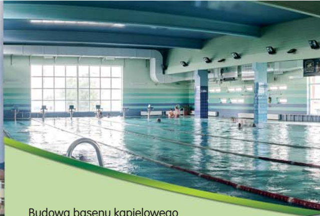
Budowa basenu kąpielowego w Bielsku-Białej. Construction of a swimming pool in Bielsko-Biala.