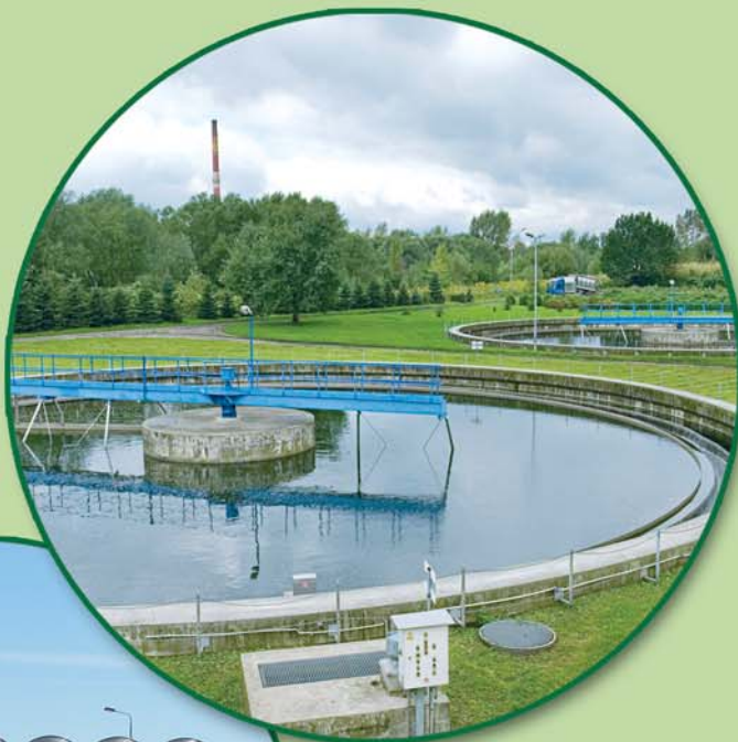
Budowa Zakładu Utylizacji i Unieszkodliwiania Odpadów Komunalnych w Prażuchach Nowych. Construction of the Communal Waste Utilization and Neutralization Plant in Prażuchy Nowe.

Modernization and development of Sewage Treatment Plant in Komorowice – the project targeted at adapting the plant to the EU requirements.